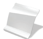
OV369 - Blanco Glaciar *