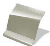
D11 - Beige Pimienta