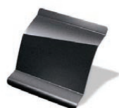
KNS - Gris Cuarzo