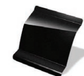
NV676 - Negro Nacré