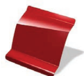
B76 - Rojo Nacré